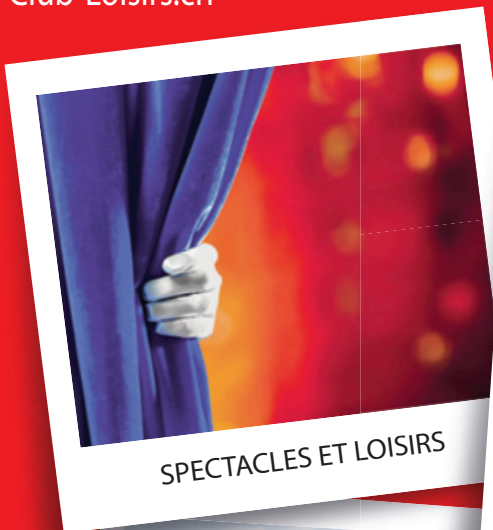
SPECTACLES ET LOISIRS

Etre abonné à L'Express ou L'Impartial, c'est bénéficier tout au long de l'année d'offres avantageuses et variées, dans les domaines des loisirs et des vacances notamment, grâce au programme et à la carte abo+. C'est de plus bénéficier gratuitement des réductions proposées par Club-Loisirs.ch