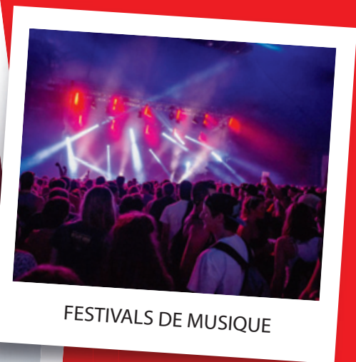
FESTIVALS DE MUSIQUE