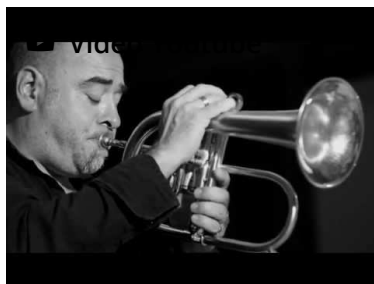
«Le jazz, c'est une histoire» - video (1)